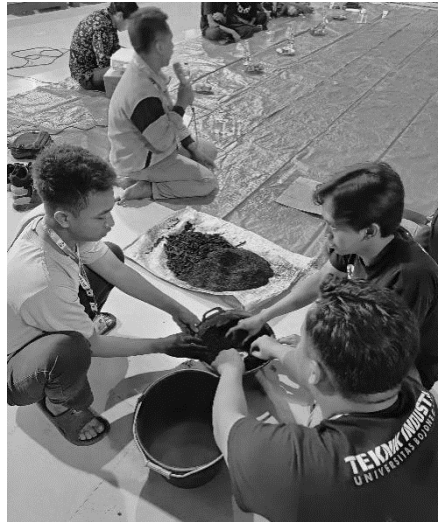
Gambar 6. Demonstrasi Pembuatan Arang Briket