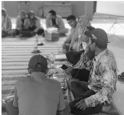
Gambar 2. Sesi Tanya Jawab

Bentuk follow up dari program kerja ini adalah pendampingan langsung bersama dengan pengurus GAPOKTAN Desa Betet mengenai penyusunan administrasi. Pendampingan ini terbagi menjadi dua agenda, yaitu pendampingan administrasi kegiatan dan pendampingan administrasi keuangan. Output dari pendampingan ini adalah GAPOKTAN Desa Betet yang lebih taat administrasi dan memiliki arsip kegiatan serta arsip keuangan yang dapat menopang kegiatan administrasi GAPOKTAN Desa Betet.