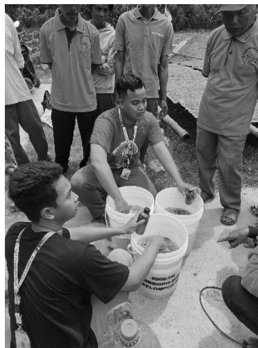
Gambar 9. Demonstrasi Pembuatan Pupuk JAKABA

Tahap demonstrasi dipraktikkan oleh mahasiswa KKN mulai dari mempersiapkan bahan-bahan yang dibutuhkan seperti air kolam, bekatul, dan bahan tambahan seperti kulit pisang serta akar bambu untuk memperkaya unsur hara. Langkah awal pembuatan JAKABA yaitu dengan memeras sari bekatul dengan air kolam. Kemudian masukkan bahan-bahan ke dalam wadah yang sudah berisi air perasan bekatul lalu tutup wadah dengan kain berpori dan ikat dengan tali atau karet. Lebih baik di jauhkan dari sinar matahari secara langsung dan di simpan di tempat yang teduh. Diamkan selama 14-30 hari, hingga terbentuk spora jamur.