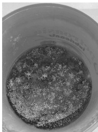
Gambar 10. Hasil POC JAKABA

Pupuk JAKABA siap panen memiliki beberapa ciri-ciri seperti pada bagian atas jamur berwarna coklat kemerahan dan pada bagian bawah berwarna lebih cerah, secara keseluruhan berbentuk seperti coral karang dengan tekstur mirip karet tapi mudah patah atau hancur. Ciri lainnya adalah air hasil fermentasi biasanya akan berwarna kecoklatan, tetapi bisa bervariasi tergantung pada bahan-bahan yang digunakan serta fermentasi mengeluarkan aroma yang cenderung tidak menyengat atau bahkan tidak berbau.