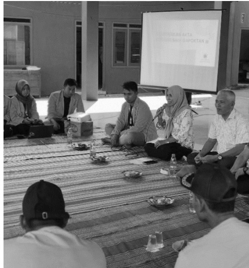
Gambar 1. Pemaparan Materi oleh Mahasiswa dan PPL DKPP