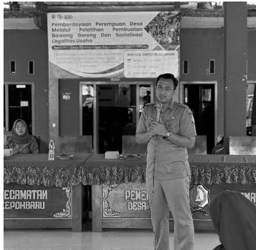
Gambar 11. Pemaparan Materi Oleh Dinas Perdagangan, Koperasi, dan Usaha Mikro

Melalui program ini perempuan Desa Betet diberi pelatihan pengolahan bawang goreng yaitu bawang goreng. Bawang goreng menjadi produk yang dipilih karena bawang merah adalah salah satu produk pertanian yang ditanam di Desa Betet yang menjadi potensi lokal. Selain itu bawang goreng merupakan produk yang mudah dibuat di rumah dan memiliki potensi pasar yang luas. Kegiatan ini diawali dengan pemaparan materi dari Dinas Perdagangan, Koperasi, dan Usaha Mikro mengenai pentingnya legalitas usaha mulai dari cara pembuatan NIB, P-IRT, HaKi, serta sertifikasi halal.