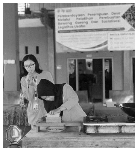
Gambar 12. Demonstrasi Pembuatan Bawang Goreng

Selain pemaparan materi, kegiatan dilanjutkan dengan demonstrasi pembuatan bawang goreng mulai dari tahap mengupas, memotong, hingga proses memasak dan yang terakhir yaitu proses packaging . Kemasan yang menarik merupakan suatu hal yang signifikan untuk produk (Irnawati & Anggapratama, 2024). Hal ini dapat menjadi keunggulan untuk dapat bersaing dengan produk sejenis lainnya (Anggapratama et al., 2024). Kemasan juga dapat berisi informasi mengenai produk didalamnya (Irnawati et al., 2024). Terdapat beberapa hal yang harus diperhatikan dalam pengemasan produk bawang goreng yaitu bagaimana cara mempertahankan tekstur produk tetap renyah atau crispy . Ada tiga cara untuk mengatasi masalah ini diterapkan yaitu pengemasan menggunakan toples, ziplock/standing pouch , dan seal .