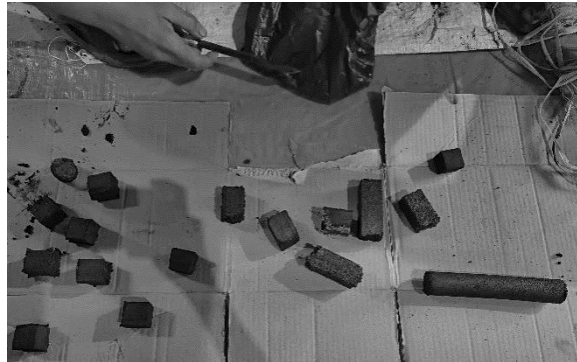
Gambar 7. Hasil Briket Arang Dari Limbah Tembakau