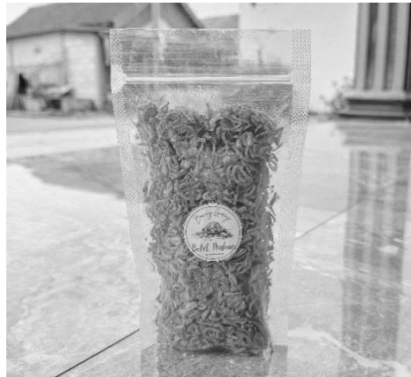
Gambar 13. Hasil Produk Bawang Goreng