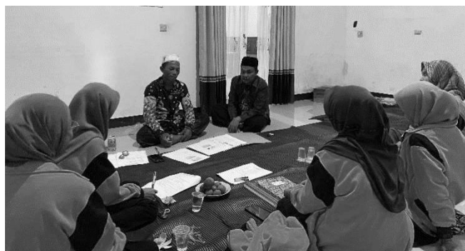
Gambar 3. Pendampingan Administrasi GAPOKTAN Desa Betet

Bentuk follow up dari program kerja ini adalah pendampingan langsung bersama dengan pengurus GAPOKTAN Desa Betet mengenai penyusunan administrasi. Pendampingan ini terbagi menjadi dua agenda, yaitu pendampingan administrasi kegiatan dan pendampingan administrasi keuangan. Output dari pendampingan ini adalah GAPOKTAN Desa Betet yang lebih taat administrasi dan memiliki arsip kegiatan serta arsip keuangan yang dapat menopang kegiatan administrasi GAPOKTAN Desa Betet.