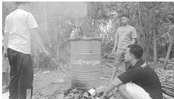
Gambar 5. Proses Pembakaran Limbah Tembakau

Proses demonstrasi dipraktikkan oleh perwakilan mahasiswa KKN Universitas Bojonegoro, mulai dari mixing bahan, blending bahan, dan cetak bahan. Namun sebelum proses mixing bahan, dilakukan proses pembakaran limbah tembakau.