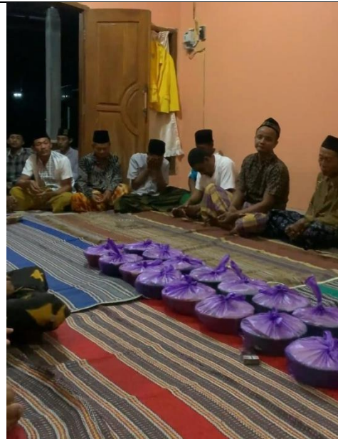
Gambar 24 Kegiatan Syukuran Penutupan KKN- TK Di Posko