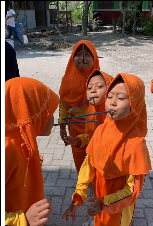
Gambar 17 Kegiatan Lomba Di SDN Sugihwaras 1