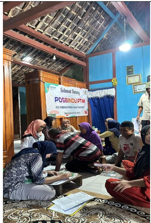
Gambar 16 Kegiatan Posbintu PTM Lansia