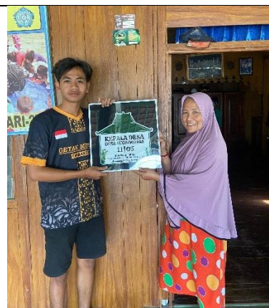
Gambar 10 Kegiatan Pemasangan Plakat Perangkat Desa