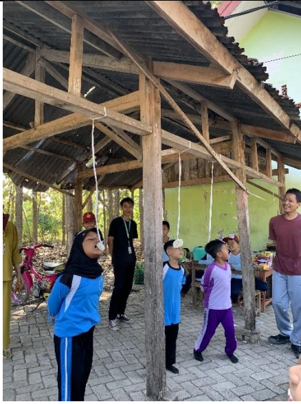
Gambar 21 Kegiatan Lomba Di SDN Sugihwaras 3