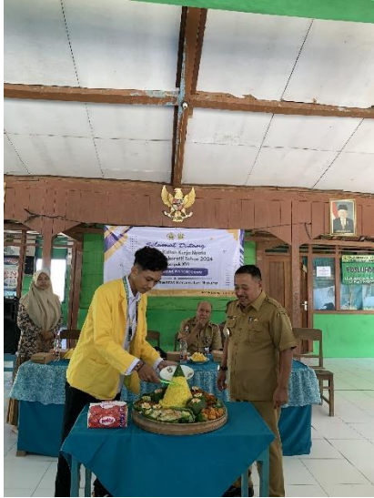
Gambar 1 Kegiatan Pembukaan KKN-TK 16 Di Desa Sugihwaras