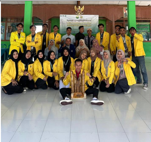
Gambar 23 Kegiatan Penutupan KKN-TK 16 Di Balai Desa Sugihwaras