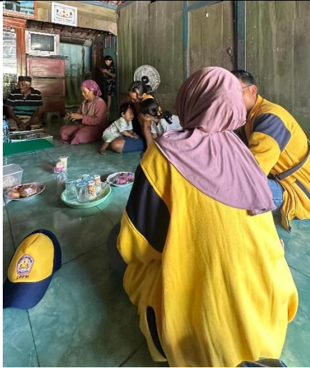
Gambar 13 Kegiatan Menyebar Undangan untuk acara Posyandu Remaja