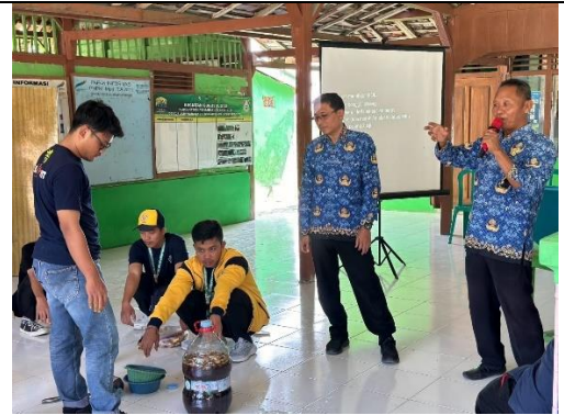
Gambar 4 Kegiatan Pelatihan Pembuatan POC