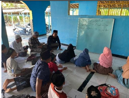
Gambar 3 Kegiatan Mengajar Ngaji Di TPQ Desa Sugihwaras