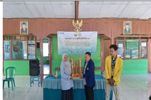
Gambar 26 Kegiatan Penyerahan Cenderamata Kepada Kepala Desa Sugihwaras