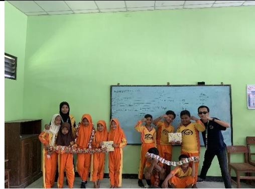
Gambar 22 Kegiatan Pembagian Hadiah Perlombaan