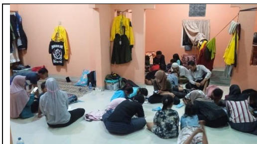
Gambar 9 Kegiatan Mengajar Les Di Posko KKN-TK 16