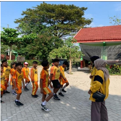
Gambar 7 Kegiatan Melatih Lomba Gerak Jalan SDN Sugihwaras 1