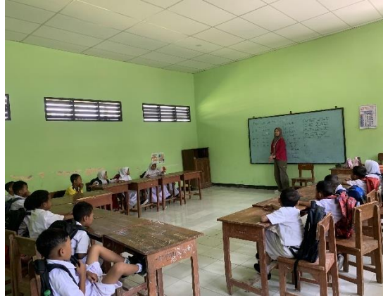
Gambar 18 Kegiatan Mengajar Di SDN Sugihwaras 1