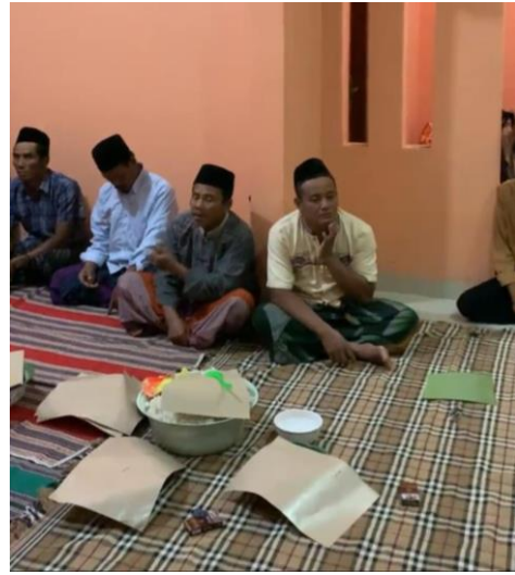
Gambar 14 Kegiatan Tasyakuran Pembukaan KKN-TK Di Posko