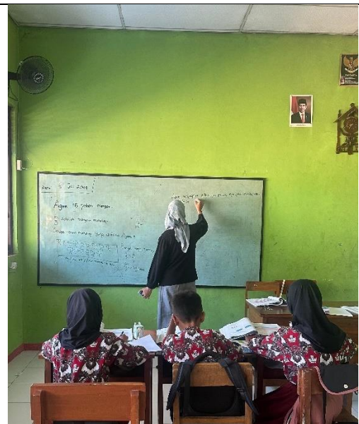
Gambar 8 Kegiatan Mengajar Di SDN Sugihwaras 3