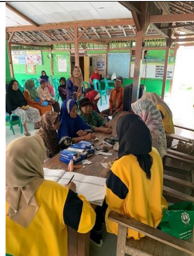
Gambar 6 Kegiatan Posyandu Lansia di Balai Desa Sugihwaras