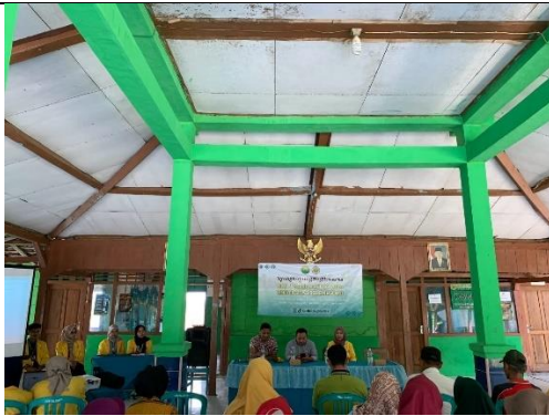
Gambar 5 Kegiatan Sosialisasi UMKM oleh Dinas Pariwisata