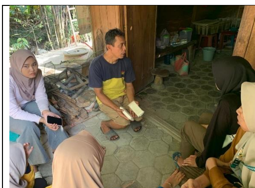
Gambar 11 Kegiatan Mendata UMKM Tahu Di Desa Sugihwaras