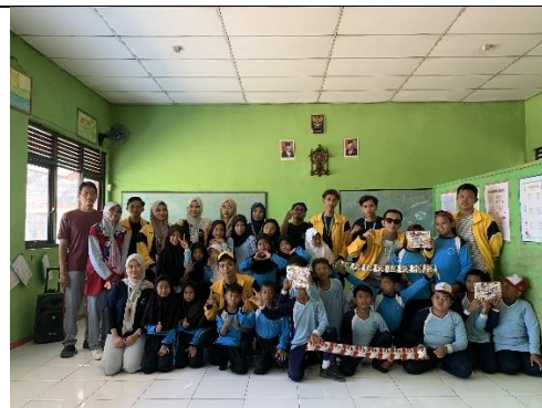
Gambar 20 Kegiatan Perpisahan dengan SDN Sugihwaras 3