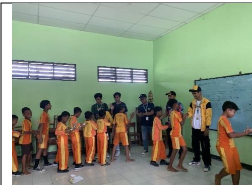
Gambar 19 Kegiatan Perpisahan dengan SDN Sugihwaras 1