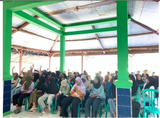
Gambar 2 Kegiatan Posyandu Remaja di Balai Desa Sugihwaras