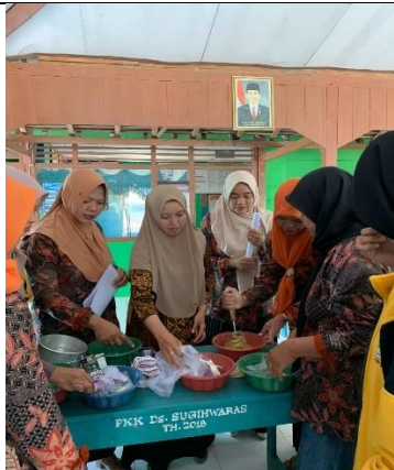
Gambar 25 Kegiatan Pelatihan Pembuatan Brownis Tempe oleh Ibu PKK