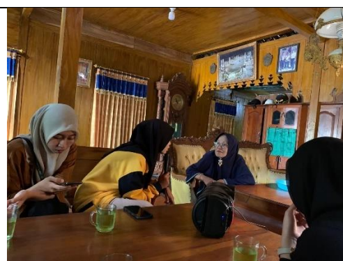
Gambar 12 Kegiatan Mendata UMKM Bakery Di Desa Sugihwaras