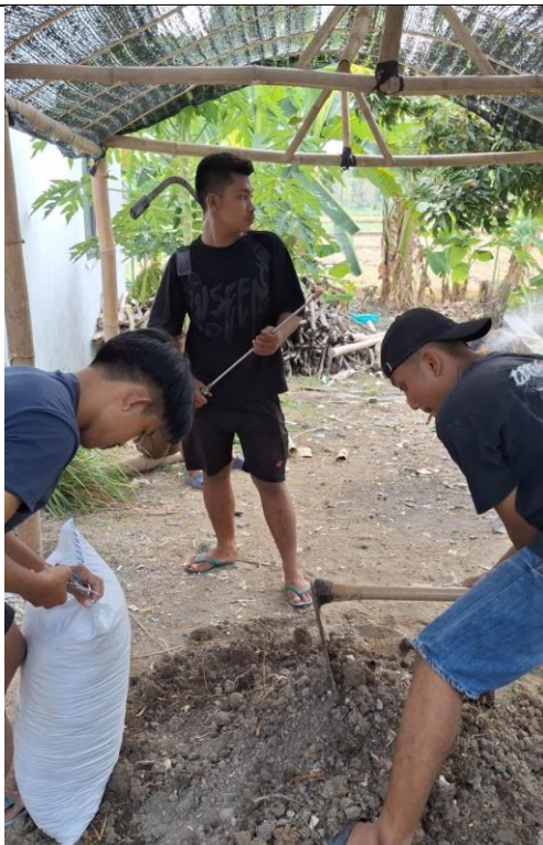
Gambar 15 Kegiatan Pembuatan Tanaman Toga Di Polindes