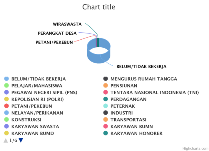
Gambar 2.2 Jenis Pekerjaan