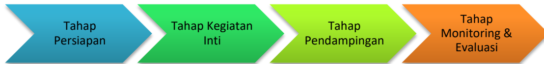
Gambar 1. Tahapan Kegiatan PKM.

fiksasi tempat dan tanggal kegiatan agar seluruh pihak dapat mempersiapkan diri secara optimal.