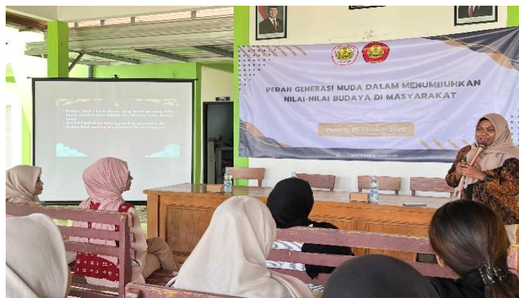
Gambar 2. Pemaparan Materi Nilai-Nilai Kebudayaan oleh Tim PKM.

Dalam paparan materinya bahwa masuknya modernitas ke dalam masyarakat lokal juga mempercepat lunturnya budaya tradisional. Modernisasi membawa perubahan dalam berbagai aspek kehidupan, mulai dari gaya hidup, pola konsumsi, hingga nilai-nilai sosial. Masyarakat yang lebih terbuka terhadap arus modernisasi cenderung mengabaikan tradisi-tradisi lama yang dianggap kuno dan tidak relevan dalam konteks zaman sekarang. Terakhir berkaitan dengan keberlanjutan modernisasi masyarakat, yaitu, pengaruh globalisasi gawai juga tidak bisa diabaikan dalam konteks ini.