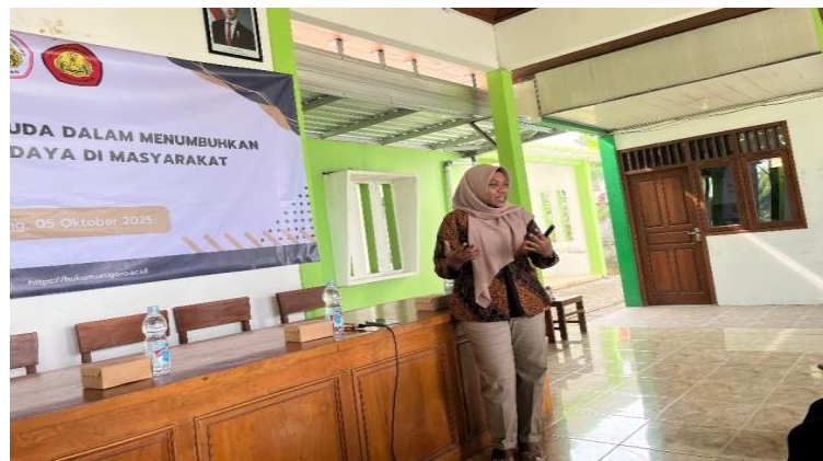
Gambar 3. Sesi Menjawab Pertanyaan Audience.

Tujuan kedua adalah mendorong keterlibatan aktif generasi muda dalam kegiatan sosial budaya di lingkungan desa. Selama ini, partisipasi pemuda sering kali menurun karena pengaruh teknologi, pola hidup modern, dan kurangnya wadah kreatif. Sosialisasi ini bertujuan membangkitkan kembali minat pemuda untuk terlibat dalam kegiatan seperti gotong royong, seni tradisional, acara keagamaan, dan musyawarah warga. Keterlibatan aktif tersebut akan memperkuat integrasi sosial dan menjaga keberlanjutan budaya. Tujuan berikutnya adalah mengembangkan rasa tanggung jawab sosial generasi muda sebagai pewaris dan penjaga budaya desa (Prameswari et al., 2025). Melalui pemahaman yang diberikan, generasi muda diharapkan memiliki kesadaran untuk melestarikan nilai-nilai budaya, meneruskannya kepada generasi berikutnya, serta mencegah terjadinya pergeseran budaya yang dapat melemahkan jati diri masyarakat (Fatonah et al., 2024). Dengan tumbuhnya rasa tanggung jawab, pemuda tidak lagi menjadi penonton, tetapi aktor yang berperan dalam menjaga keberlangsungan budaya lokal.