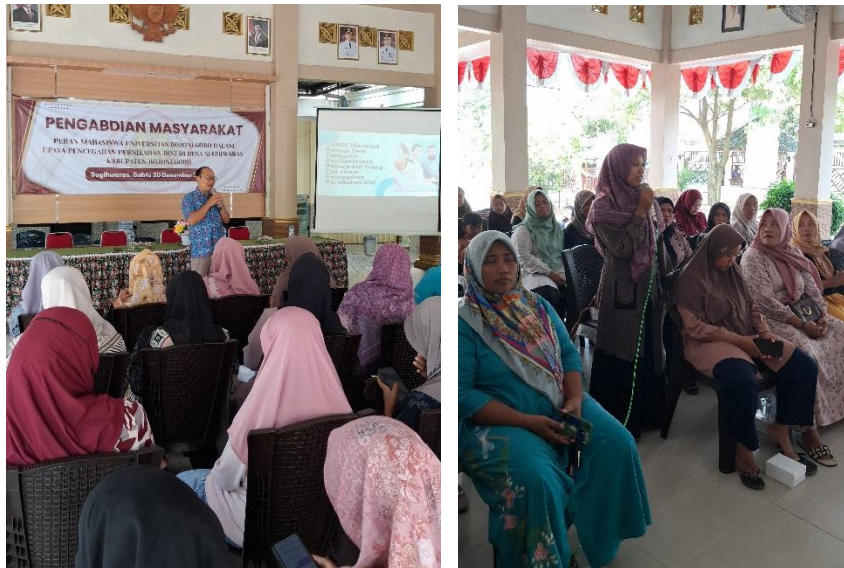
Gambar 1. Kegiatan Sosialisasi dan Edukasi

tekanan lingkungan, serta pola pikir keluarga yang perlu dibangun secara lebih mendukung tumbuh kembang remaja. Kegiatan ini juga menekankan pentingnya perencanaan masa depan, kelanjutan pendidikan, serta kesiapan emosional dan ekonomi sebelum menikah, sehingga remaja terdorong memiliki keberanian menyampaikan pendapat, menetapkan cita-cita, dan mengambil keputusan hidup secara bertanggung jawab. Pendekatan yang digunakan selaras dengan tujuan program dalam memperkuat ketahanan remaja melalui dukungan keluarga dan lingkungan desa, sehingga pencegahan pernikahan dini dipahami sebagai tanggung jawab bersama antara remaja, keluarga, dan komunitas.