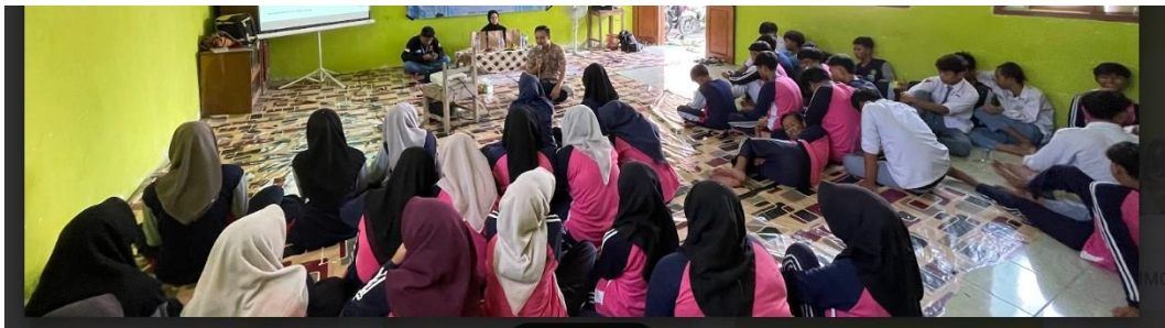
Gambar 5.1.4 Pengisian Kuisisioner post test

Selain siswa, guru Bimbingan Konseling dan wali kelas juga dilibatkan dalam kegiatan ini untuk memperkuat keberlanjutan program. Guru diberikan pemahaman mengenai teknik dasar komunikasi empatik, pendampingan psikologis sederhana, serta pemanfaatan modul pendampingan sebagai alat intervensi lanjutan di lingkungan sekolah.