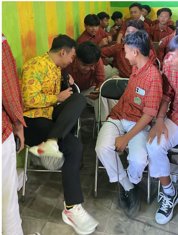
Gambar 5.1.1 Pengisian Kuisisioner pre test

Adapun Kegiatan pengabdian kepada masyarakat ini dilaksanakan di MA Al-Abror Sukosewu dengan sasaran utama siswa tingkat Madrasah Aliyah serta melibatkan guru Bimbingan Konseling dan wali kelas sebagai mitra pendamping. Program pendampingan dilaksanakan melalui beberapa tahapan utama, yaitu tahap persiapan, asesmen awal (pre-test), pelaksanaan pelatihan psikologi, serta evaluasi akhir (post-test).