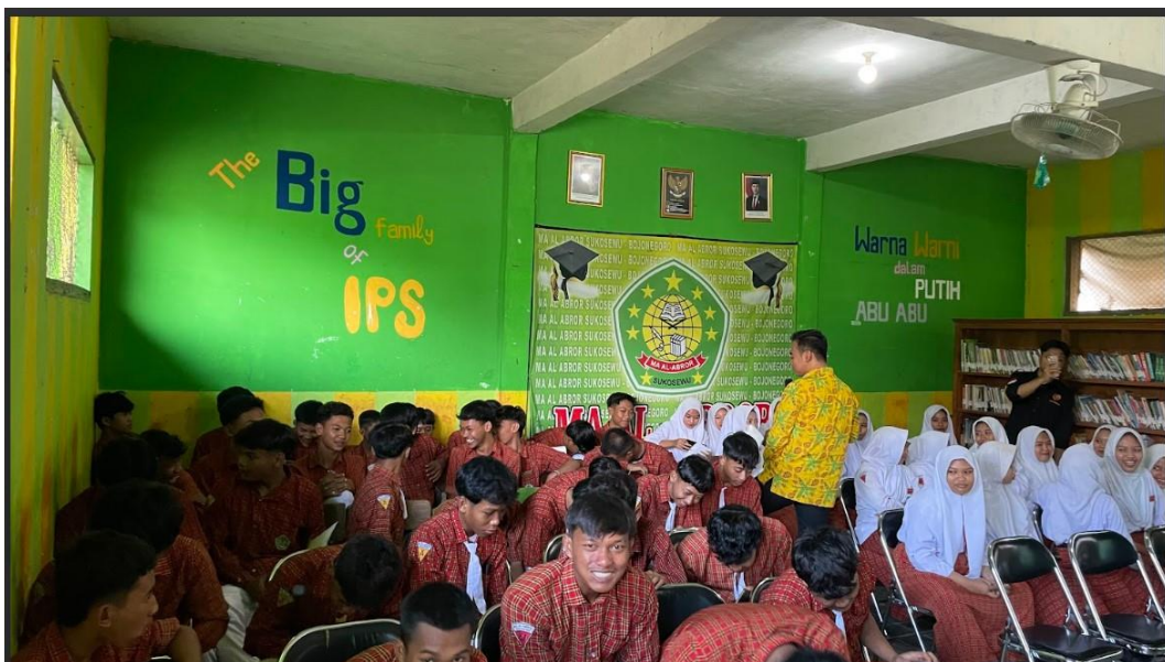
Gambar 5.1.2 Pemberian materi self awareness

Tahap selanjutnya adalah pemberian materi psikologi remaja yang terdiri dari dua materi utama, yaitu tentang self-awareness dan emotional regulation . Pelatihan self-awareness difokuskan pada peningkatan kemampuan siswa dalam mengenali potensi diri, memahami emosi, serta membangun orientasi masa depan yang positif. Kegiatan dilakukan melalui metode interaktif seperti refleksi diri, diskusi kelompok, serta simulasi kasus. Siswa diajak untuk mengidentifikasi tujuan hidup, nilai pribadi, serta faktor-faktor yang memengaruhi keputusan penting dalam kehidupan mereka.