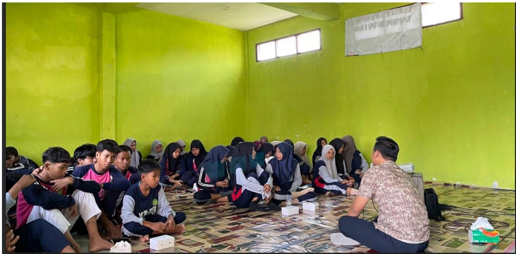
Gambar 5.1.3 Pemberian materi tahap emotion regulation

Selain siswa, guru Bimbingan Konseling dan wali kelas juga dilibatkan dalam kegiatan ini untuk memperkuat keberlanjutan program. Guru diberikan pemahaman mengenai teknik dasar komunikasi empatik, pendampingan psikologis sederhana, serta pemanfaatan modul pendampingan sebagai alat intervensi lanjutan di lingkungan sekolah.