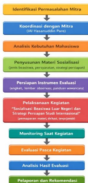
Gambar 1. Tahapan Kegiatan Pengabdian Masyarakat

Mitra kegiatan adalah Institut Agama Islam (IAI) Hasanuddin Pare, sebuah perguruan tinggi swasta yang berlokasi di sekitar Kampung Inggris Pare, Kabupaten Kediri, Jawa Timur. Mitra dipilih karena memiliki mahasiswa dengan minat tinggi terhadap penguasaan bahasa Inggris, namun masih terbatas dalam akses informasi beasiswa luar negeri. Kegiatan ini melibatkan kurang lebih 30 mahasiswa dengan latar belakang akademik dan tingkat kesiapan yang beragam. Adapun tahap pelaksanaan kegiatan bisa dilihat pada gambar berikut.