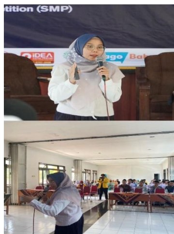
Gambar 2. Proses penyampaian mater

Selain penyampaian materi, kegiatan juga dilengkapi dengan diskusi dan sesi tanya jawab yang memungkinkan mahasiswa menyampaikan pertanyaan serta pengalaman pribadi mereka. Antusiasme peserta terlihat dari keaktifan dalam diskusi dan banyaknya pertanyaan yang diajukan terkait strategi lolos seleksi beasiswa. Proses penyampaian materi dan interaksi dengan peserta ditunjukkan pada Gambar 3, yang menggambarkan suasana sosialisasi berlangsung dan bisa dilihat di bawah ini.