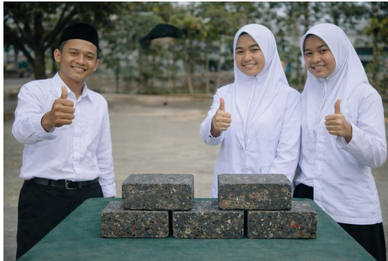
Gambar 5. 2 Hasil produk paving block dari sampah plastik karya peserta didik.

terhadap permukaan, uji kepadatan manual, serta uji ketahanan terhadap air. Peserta didik terlihat antusias saat melihat hasil produk yang berhasil dibuat. Tahap evaluasi ini bertujuan untuk memastikan kualitas paving block sesuai dengan standar kekuatan non-struktural.