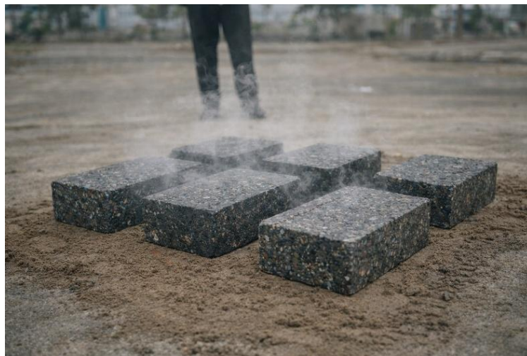
Gambar 5. 1 Proses pendinginan paving block hingga mengeras.

Langkah selanjutnya adalah pemadatan campuran di dalam cetakan menggunakan alat tekan manual. Pemadatan bertujuan untuk meningkatkan kepadatan material serta mengurangi rongga udara di dalam paving block. Peserta didik terlihat aktif melakukan tekanan secara bergantian. Tahap ini sangat penting karena berpengaruh langsung terhadap kekuatan tekan dan ketahanan paving block yang dihasilkan.