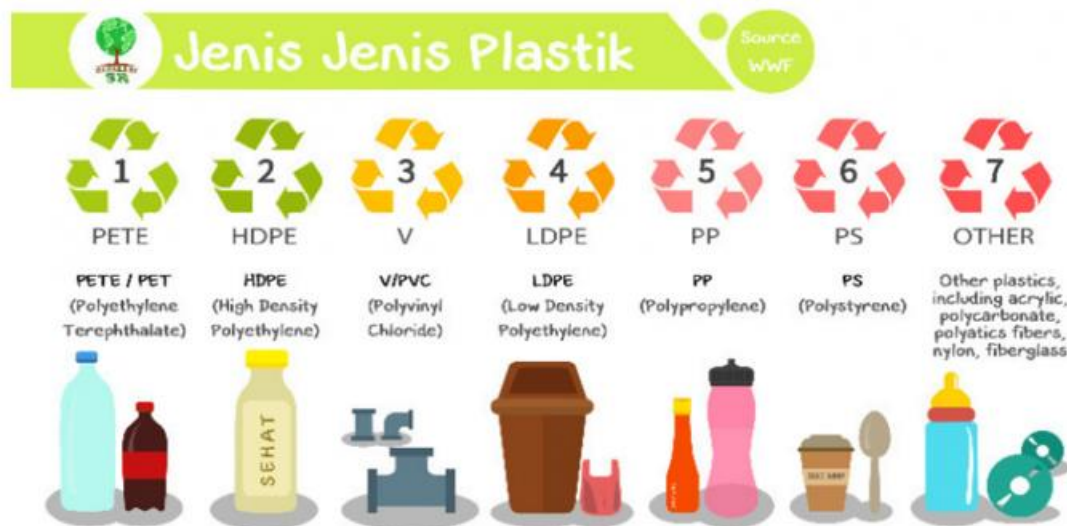
Gambar 2. 1 Jenis Plastik

Berdasarkan kode resin (Resin Identification Code), sampah plastik dibagi menjadi tujuh jenis: