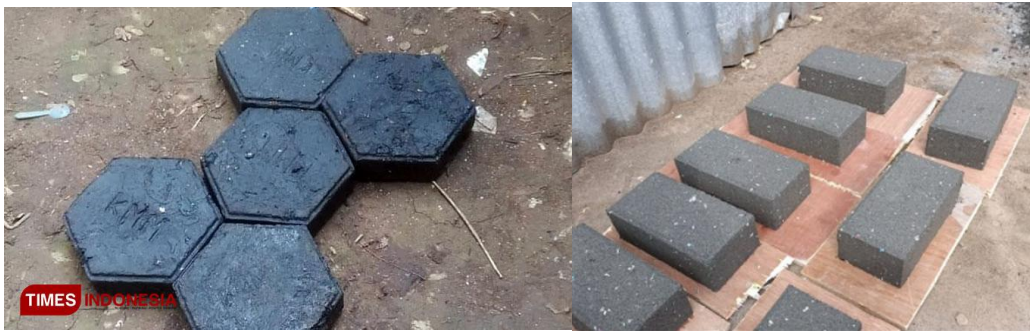
Gambar 2. 2 Produk Paving Block dari Sampah Plastik

Paving block didiamkan hingga mengeras dan siap dilepas dari cetakan.