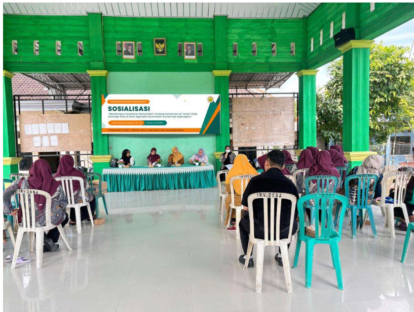
Gambar 4.1 Situasi Pemaparan

Perubahan paradigma ini adalah bukti nyata bahwa krisis lingkungan dapat memicu evolusi positif dalam pemikiran dan perilaku manusia. Dari pandangan yang berfokus pada eksploitasi, kita telah beralih ke kesadaran akan keberlanjutan. Masa depan pasokan air kita bergantung pada kemampuan kita untuk terus melihat air tanah bukan hanya sebagai sumber daya, tetapi sebagai warisan alam yang harus kita lindungi dan jaga untuk generasi mendatang. Kita telah menyadari bahwa tindakan kecil yang kita lakukan hari ini, seperti tidak membuang-buang air dan berpartisipasi dalam program konservasi, akan memiliki dampak besar di masa depan