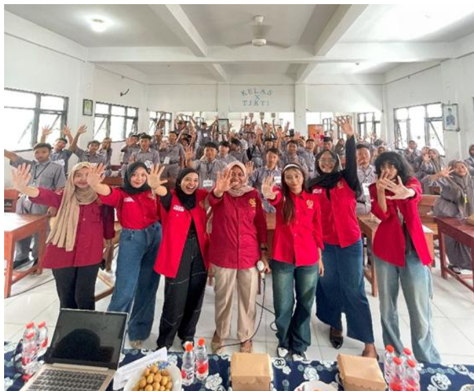
Gambar 2: Partisipasi siswa dan siswi SMK GAMA Kedungadem

Upaya yang dapat dilakukan untuk mengatasi dan menanggulangi bullying melalui pendidikan (Munawir, 2024): Memperkuat pengendalian sosial, dengan melakukan pengawasan dan penindakan, Mengembangkan budaya meminta dan memberi maaf, Menerapkan prinsip-prinsip anti kekerasan, Memberikan pendidikan perdamaian kepada generasi muda, Meningkatkan dialog dan komunikasi intensif antar siswa dalam sekolah.