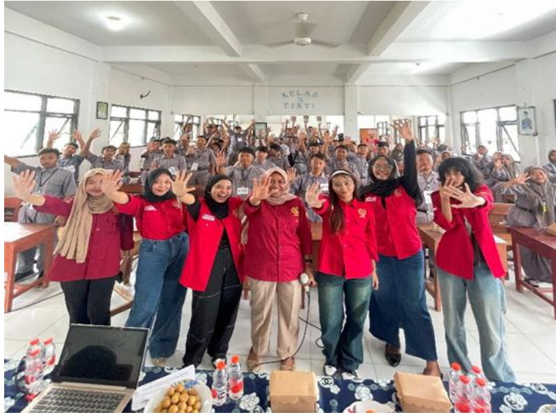
Gambar2: Partisipasi siswa dan siswi SMK GAMA Kedungadem

Kemudian juga penjelasan materi sosialisasi tentang Dalam Undang-Undang Nomor 35 Tahun 2014 tentang Perubahan atas Undang-Undang Nomor 23 Tahun 2002 tentang Perlindungan Anak (UU No.35/2014), definisi Kekerasan adalah setiap perbuatan terhadap Anak yang berakibat timbulnya kesengsaraan atau penderitaan secara fisik, psikis, seksual, dan/atau penelantaran, termasuk ancaman untuk melakukan perbuatan, pemaksaan, atau perampasan kemerdekaan secara melawan hukum”. Tanggung jawab untuk melindungi warganya dari segala bentuk kekerasan tidak hanya terletak pada individu atau keluarga, tetapi juga menjadi tugas negara. Termasuk menjamin bahwa hukum dan kebijakan yang ada tidak hanya melindungi hak-hak warga negara tetapi juga menegakkan keadilan bagi korban kekerasan (Prastini, 2024). Kewajiban ini tertuang jelas dalam Pembukaan Undang-Undang Dasar Negara RI Tahun 1945 yang menekankan pentingnya melindungi segenap bangsa dan seluruh tumpah darah Indonesia.