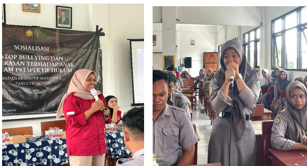
Gambar 1: Penyampaian Materi dan Sesi Tanya Jawab

penyuluhan dilakukan di SMK GAMA Kedungadem pada Tanggal 25 Februari 2025. Sosialisasi: Lokasi kegiatan yang bertempat pada Aula SMK GAMA Kedungadem pada Tanggal 25 Februari 2025 dihadiri oleh 65 Siswa dan siswi. Tentu dengan menggunakan metode penyampaian Materi sampai dengan selesai dan disusul dengan sesi tanya jawab seputar materi yang di sampaikan kaitannya dengan bullying dan kekerasan terhadap anak dalam perspektif hukum. Tentu juga dengan menggunakan strategi yang dilakukan adalah Sosialisasi. Melakukan pemahaman luas tentang kampanye materi bullying dan kekerasan terhadap anak dalam perspektif hukum. Proses pemberian materi ini berlangsung dengan begitu banyak antusias pertanyaan dari para siswa dan siswi SMK GAMA Kedungadem. Yang justru menyambut baik kaitannya dengan sosialisasi bullying dan kekerasan terhadap anak dalam perspektif hukum