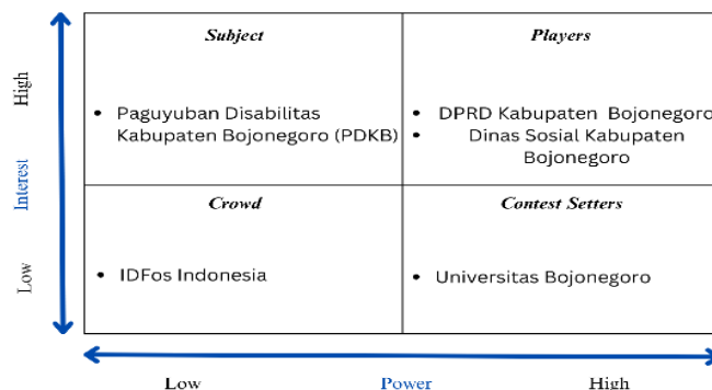
Gambar 2 Kuadran Power vs Interest Grid Klasifikasi Stakeholder Perumusan Perda Disabilitas

Berdasarkan penelitian, selanjutnya dilakukan pengklasifikasian stakeholder dengan menggunakan matriks model grid, dengan hasil seperti di bawah ini: