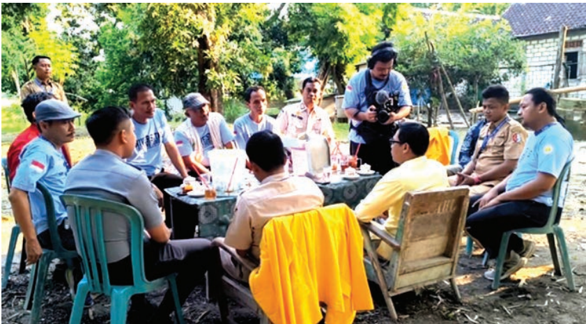
Proses pengambilan gambar dengan melibatkan Dosen Pendamping Lapangan dan sebagian Kelompok KKN-TK 28

Pembahasan kemudian mengalir ke program Gayatri , pelestarian warisan leluhur, pengembangan UMKM, kolaborasi dengan mitra, hingga pengelolaan anggaran yang harus transparan. Lalu ada