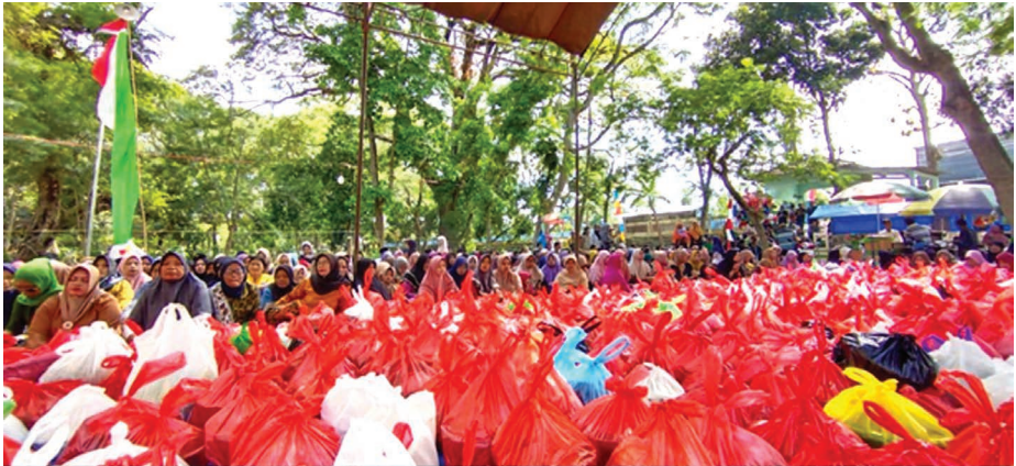
Kegiatan nyadran/manganan yang biasanya setiap warga berkumpul satu lokasi yang disakralkan dengan membawa nasi, dan doa bersama.

Tradisi dan budaya menjadi bagian penting dari kehidupan Kalirejo. Salah satu yang paling mencolok adalah Sedekah Bumi, atau Manganan, yang digelar setahun sekali. Perayaan ini bukan sekadar ritual adat, tapi juga momentum kebersamaan: bersih-bersih desa, doa bersama, tumpengan, pertunjukan wayang, dan ziarah ke makam para tokoh leluhur. Wayang yang dulunya adalah Wayang Krucil, diganti menjadi Wayang Thengul karena pertimbangan biaya. Perubahan bentuk pertunjukan tidak mengurangi maknanya—wayang tetap menjadi wahana nasihat, hiburan, dan pemersatu warga.