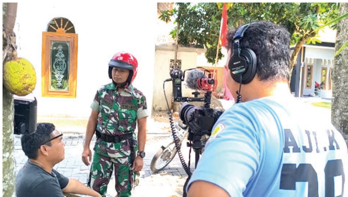
Proses pengambilan gambar untuk produksi video Kelompok KKN-TK 28

Kami bergerak ke rumah Pak Sanaji, salah satu penerima program Gayatri. Adegan pertama dimulai dengan dua bapak-bapak tengah asyik memainkan bidak catur di pinggir jalan. Jari mereka bergerak hati-hati, seolah setiap langkah bidak bisa menentukan harga cabai esok pagi.