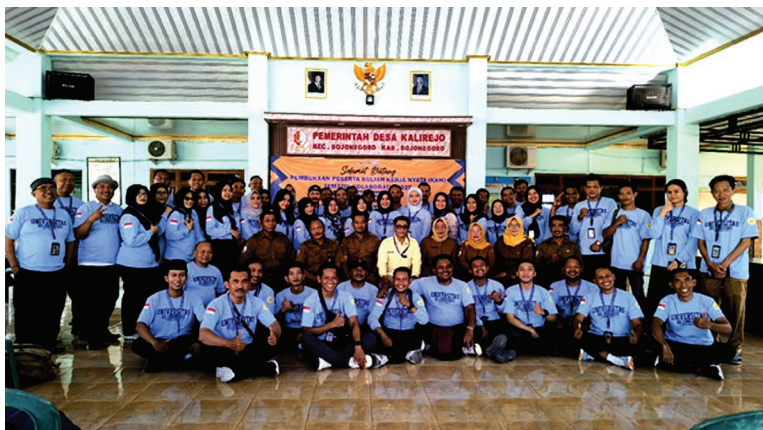
Foto bersama dalam acara pembukaan KKN-TK Kelompok 28 di Balai Desa Kalirejo

Tahun 2025, Universitas Bojonegoro (Unigoro) kembali mengirimkan mahasiswa untuk melaksanakan Kuliah Kerja Nyata (KKN) di berbagai desa. Mengusung tema umum “Optimalisasi Potensi Desa dalam Mendukung Pengembangan Geopark untuk Mewujudkan Pembangunan Berkelanjutan”, program ini menjadi ruang kolaborasi antara mahasiswa dan masyarakat dalam menggali, mengembangkan, sekaligus melestarikan potensi yang ada. Dalam konteks Bojonegoro, Geopark sendiri mencakup tiga pilar penting, yaitu geosite (situs geologi), biosite (keanekaragaman hayati), dan culture site (warisan budaya). Dalam kerangka besar inilah, Desa Kalirejo mengambil peran melalui pelestarian situs budaya dan tradisi yang hidup di tengah masyarakatnya.