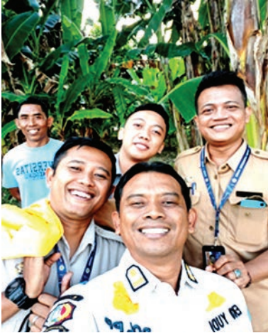
Swafoto usai proses pengambilan gambar.

Lucunya, meskipun banyak dari kami yang gagap akting, tidak ada satu pun yang mengeluh atau ngambek. Sebaliknya, kami justru saling menyemangati, membantu satu sama lain agar semua bisa berjalan lancar dan sesuai rencana, atau setidaknya, mendekati rencana.