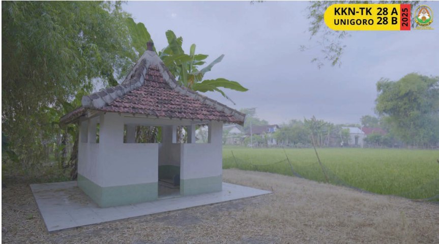
Makam Mbah Jori di RT 08 sebelum direnovasi oleh kelompok KKN-TK 28

meski tidak memiliki geosite atau biosite yang menonjol, tapi memiliki kekuatan dalam potensi budaya yang bisa diintegrasikan ke dalam pengembangan geopark Bojonegoro.