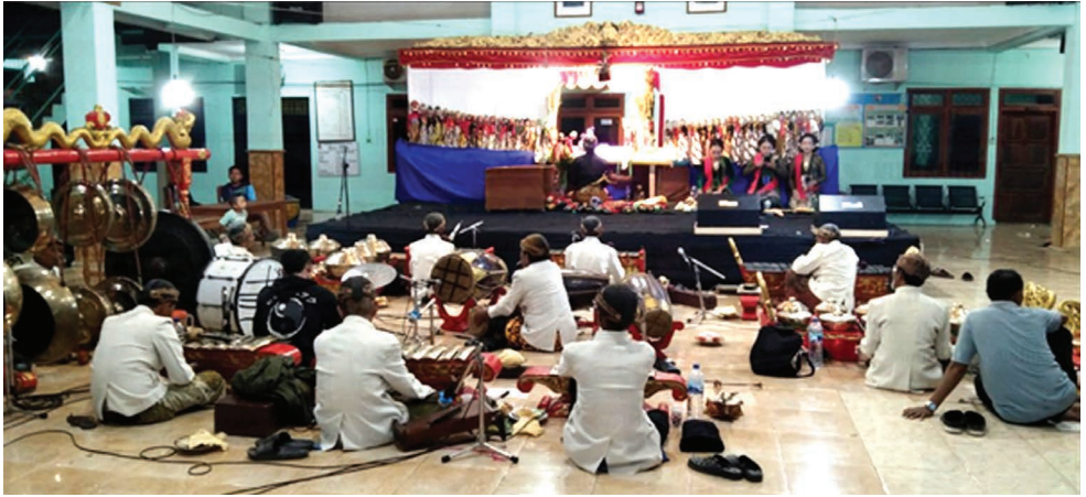
Pertunjukan Seni Wayang Tengul, salah satu bagian dari tradisi nyadran/manganan .

Seluruh tokoh ini kini dikenal sebagai leluhur atau dahyang di tempat masing-masing. Belakangan, setiap Selasa Kliwon, masyarakat menggelar ritual manganan ( nyadran ) alias sedekah bumi setelah panen raya. Urutannya mengikuti jejak para leluhur: dimulai dari Mori, Ledok, Campurrejo, Kalirejo, lalu Kendalrejo.