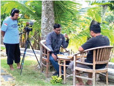
Proses pengambilan gambar untuk produksi video Kelompok KKN-TK 28

Tanggal 9 Agustus 2025 mungkin akan selalu tercetak tebal di kalender kenangan kami, anggota Kelompok KKN 28 Universitas Bojonegoro. Bukan hanya karena itu hari kami tampil rapi di depan kamera, tetapi juga karena segala kekacauan, tawa, dan kepanikan yang terjadi di balik layar.