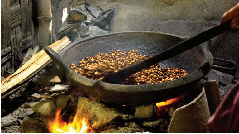
Proses pengambilan gambar di warung kopi tradisional rumahan Desa Kalirejo.