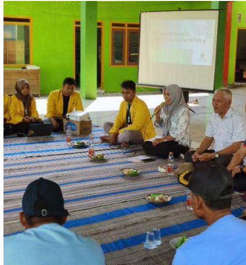
Gambar 1. Pemaparan Materi Manajemen Keuangan serta Administrasi untuk GAPOKTAN

Sosialisasi dan Pendampingan Manajemen Keuangan serta Administrasi GAPOKTAN bertujuan untuk memberikan pemahaman yang baik mengenai manajemen keuangan secara sederhana yang mana dapat membantu dalam penggunaan uang yang dimiliki dengan lebih baik serta memahami untung-rugi dari usaha tani [8]. Selain itu juga untuk mendorong keteraturan dalam manajemen administrasi kegiatan, seperti: surat-menyurat, pencatatan barang dan kearsipan [9].