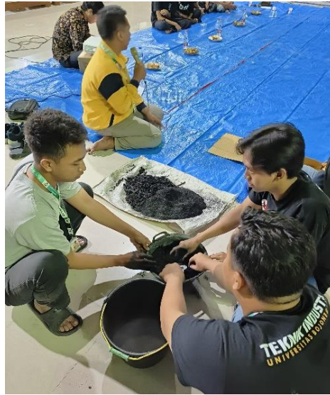
Gambar 2. Demonstrasi Pembuatan Briket dari Limbah Batang Tembakau

Tembakau merupakan salah satu komoditas pertanian yang menjadi potensi dari Desa Betet setelah padi. Saat musim panen tembakau tiba, kebanyakan batang tembakau akan menjadi limbah karena yang dimanfaatkan hanya daunnya saja. Untuk memanfaatkan limbah batang tembakau yang nantinya akan terbuang sia-sia, kami berinisiatif untuk memanfaatkan limbah batang tembakau menjadi alternative bahan baku pembuatan briket.