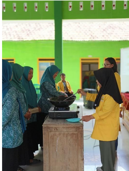
Gambar 4. Demonstrasi Pembuatan Bawang Goreng

Program kerja ini terdiri dari Sosialisasi Legalitas Usaha oleh Dinas Perdagangan, Koperasi dan Usaha Mikro serta Pelatihan Pembuatan Bawang Goreng. Sasaran dari program kerja ini adalah perempuan desa yang tergabung dalam PKK (Pemberdayaan dan Kesejahteraan Keluarga). Sehingga dengan adanya program kerja ini, diharapkan dapat memberikan stimulus bagi perempuan Desa Betet untuk memulai berwirausaha secara mandiri.