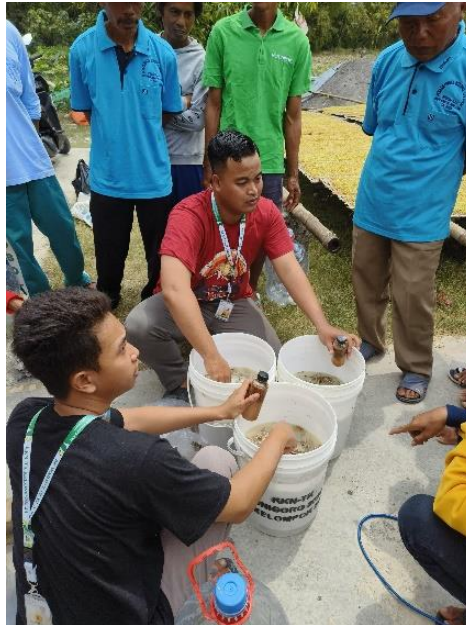
Gambar 3. Demonstrasi Pembuatan POC JAKABA

Pupuk Organik Cair (POC) merupakan pupuk yang dibuat secara alami melalui proses fermentasi dan umumnya berasal dari limbah organik yang mudah ditemukan [11]. Dengan adanya sosialisasi dan pelatihan pembuatan pupuk organik cair (POC), kami mengharapkan para petani di Desa Betet mampu melepas ketergantungan mereka pada pupuk kimia, karena hal tersebut dapat merusak kesuburan tanah apabila digunakan secara terus-menerus. Meskipun penggunaan POC memerlukan proses dan waktu dalam proses pembuatan dan tidak memberikan hasil yang instan, paling tidak POC dapat membantu para petani dalam memenuhi kebutuhan pupuk subsidi. Sasaran dari program kerja ini adalah anggota kelompok tani (POKTAN SUMBER REJEKI) dan GAPOKTAN Desa Betet.