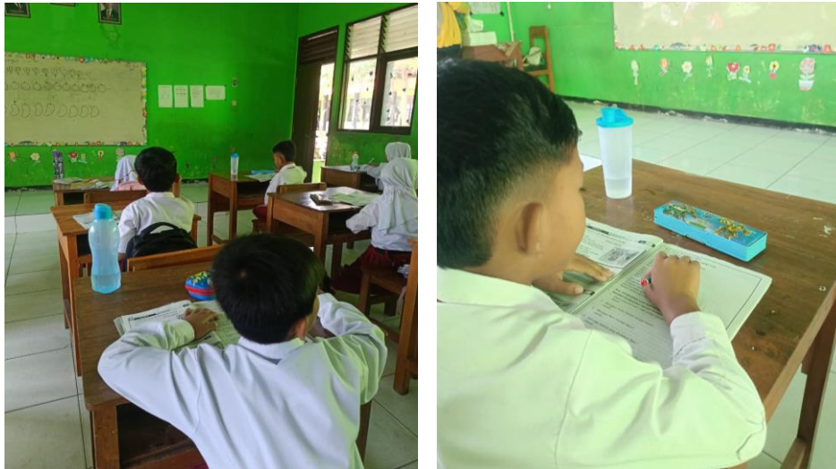
Gambar 3. 28 Membantu Kegiatan Pembelajaran di SDN

Dalam pelaksanaannya, mahasiswa KKN terlibat langsung dalam proses pembelajaran dan membantu ustadz/ustadzah di TPQ. Kegiatan yang dilakukan meliputi penyampaian materi pelajaran, pendampingan membaca dan menulis, serta membimbing hafalan dan praktik ibadah dasar di TPQ.