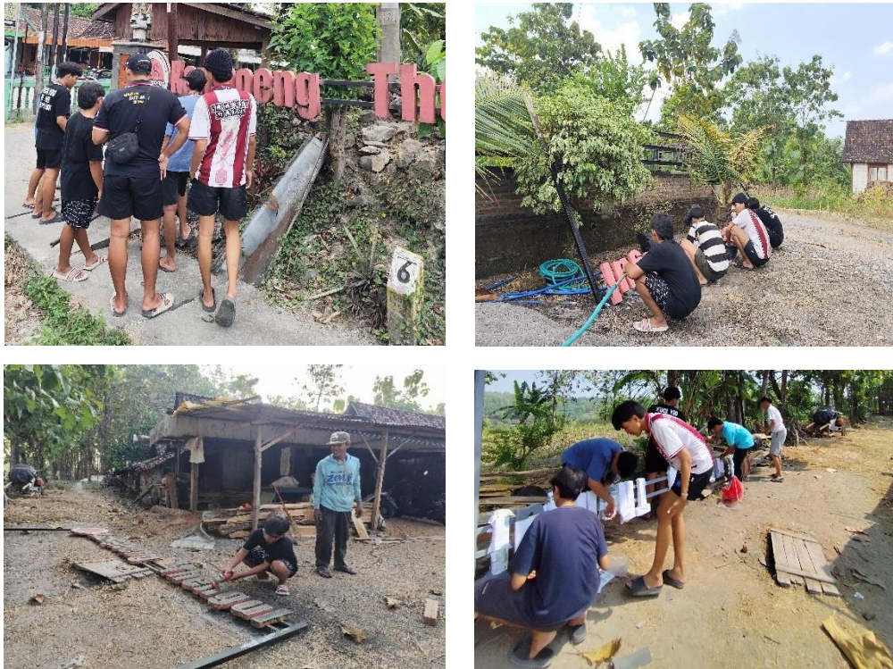
Gambar 3. 37 Revitalisasi Plang Nama Kampong Thengul

melalui pengecatan ulang. Program ini dilaksanakan sebagai bentuk kepedulian mahasiswa terhadap pelestarian identitas budaya Desa Sumberjo