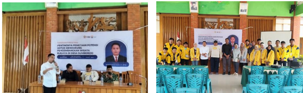
Gambar 3. 43 Sosialisasi Tentang Pentingnya Peta Potensi

Desa Sumberjo memiliki kekayaan budaya berupa seni pertunjukan Wayang Thengul dan berbagai potensi lokal lainnya yang dapat dikembangkan menjadi daya tarik wisata. Namun, potensi tersebut perlu dipetakan secara sistematis agar desa memiliki data yang jelas terkait sumber daya, fasilitas, dan peluang pengembangan. Oleh karena itu, sosialisasi ini menekankan pentingnya pemetaan sebagai dasar pengambilan keputusan, perencanaan pembangunan, serta promosi desa kepada pihak luar.