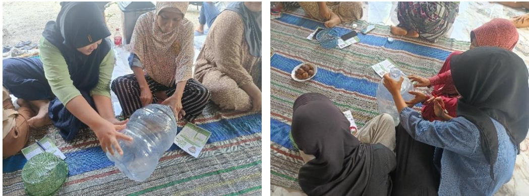
Gambar 3. 19 Workshop Akuaponik Sederhana Menggunakan Media Galon Bekas

Program kerja pendamping KKN-TK 17 Universitas Bojonegoro adalah edukasi akuaponik sederhana dengan menggunakan media galon bekas. Kegiatan ini dilaksanakan sebagai upaya memperkenalkan teknologi pertanian terpadu yang ramah lingkungan, hemat biaya, minim penggunaan lahan, serta memanfaatkan barang bekas agar lebih bermanfaat.