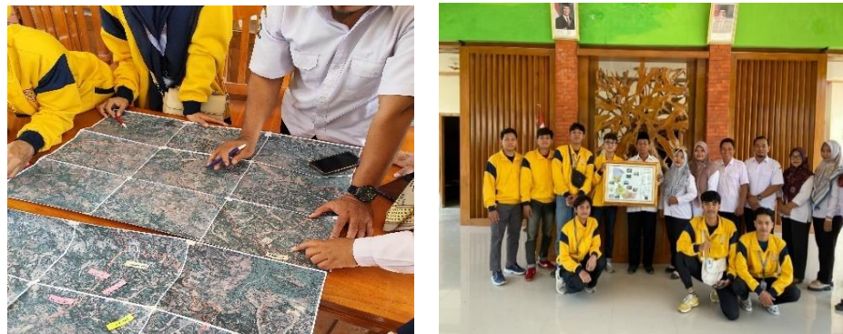
Gambar 3. 1 Pengambilan Data dan Penyerahan Peta

Program kerja utama KKN-TK 17 Universitas Bojonegoro adalah pembuatan peta potensi desa berbasis QGIS. Kegiatan ini bertujuan untuk memetakan secara detail letak desa, batas antar dusun, serta potensi yang dimiliki oleh desa, khususnya pada aspek usaha mikro, kecil, dan menengah (UMKM). Melalui pemanfaatan aplikasi QGIS ( Quantum Geographic Information System ), data yang diperoleh dari observasi lapangan dan wawancara dengan perangkat desa diolah menjadi peta digital yang informatif, akurat, dan mudah dipahami.[5].