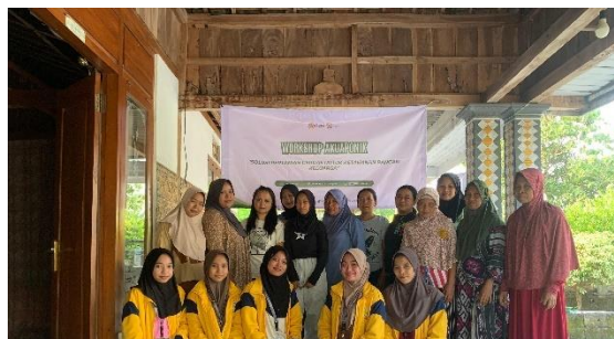
Gambar 3. 22 Workshop Akuaponik Bersama Ibu-Ibu Dusun Kedung Krambil

Dalam program ini, kelompok KKN memberikan sosialisasi dan pendampingan kepada masyarakat mengenai cara membuat akuaponik sederhana menggunakan galon bekas. Selain mudah dibuat, metode ini tidak memerlukan biaya besar dan dapat diterapkan di pekarangan rumah,