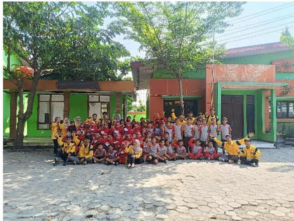
Gambar 3. 25 Membantu Mengisi Kegiatan MPLS di SDN Sumberjo 3