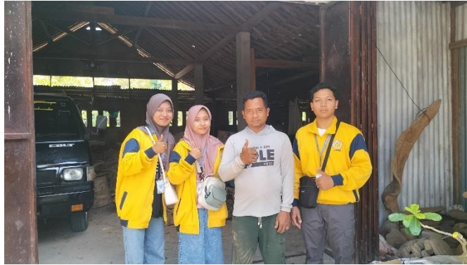
Gambar 3. 16 Berkunjung ke Produksi Kerajinan Tunggak Kayu

Melalui program ini, kelompok KKN melakukan pendampingan kepada pelaku UMKM dalam memperkenalkan produk lokal dengan memanfaatkan teknologi digital. Strategi yang dilakukan meliputi pembuatan desain promosi, serta produksi konten foto dan video produk. Selain itu, pelaku UMKM juga