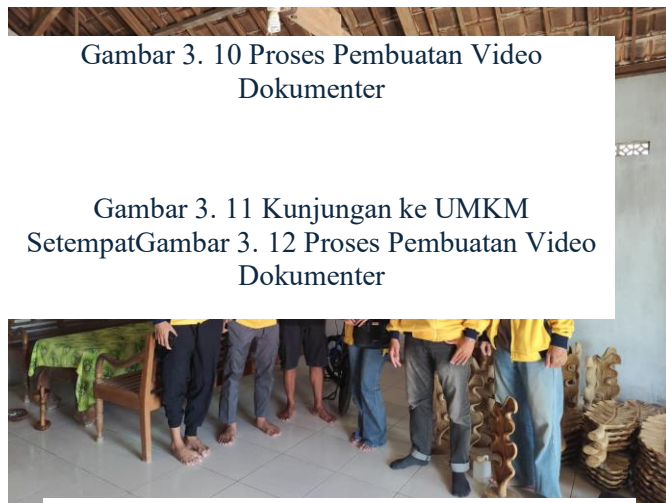
Gambar 3. 10 Proses Pembuatan Video Dokumenter

Program kerja utama KKN-TK 17 Universitas Bojonegoro adalah promosi produk lokal melalui pendekatan digital. Kegiatan ini dilaksanakan sebagai bentuk dukungan terhadap pengembangan potensi ekonomi desa, khususnya di sektor usaha mikro, kecil, dan menengah (UMKM) yang menjadi penggerak utama perekonomian masyarakat. [7].