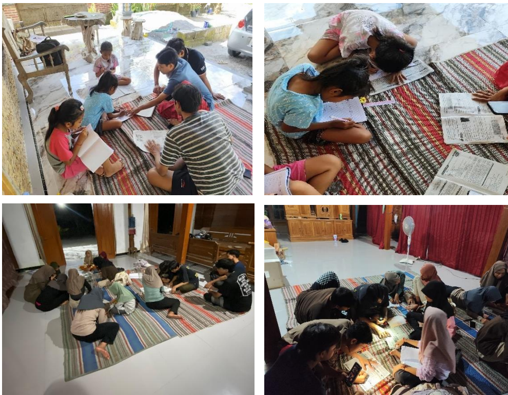
Gambar 3. 34 Mengadakan Bimbingan Belajar di Posko KKN

Bimbingan belajar ini dilaksanakan secara rutin di Posko KKN dengan pendekatan yang interaktif dan menyenangkan. Mahasiswa KKN mendampingi dan membantu siswa dalam mengerjakan tugas sekolah, menjelaskan materi pelajaran yang dirasa sulit, serta memberikan latihan tambahan sesuai kebutuhan siswa.