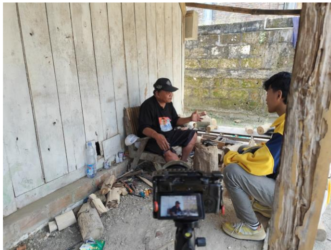
Gambar 3. 7 Wawancara Untuk Video Dokumenter

Kegiatan ini bertujuan untuk mendokumentasikan sekaligus memperkenalkan salah satu kekayaan budaya lokal Desa Sumberjo, yaitu seni pertunjukan Tari Jumentara dan Karawitan Wayang Thengul, agar lebih dikenal oleh masyarakat luas.