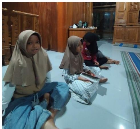
Gambar 3. 31 Mengajar Mengaji