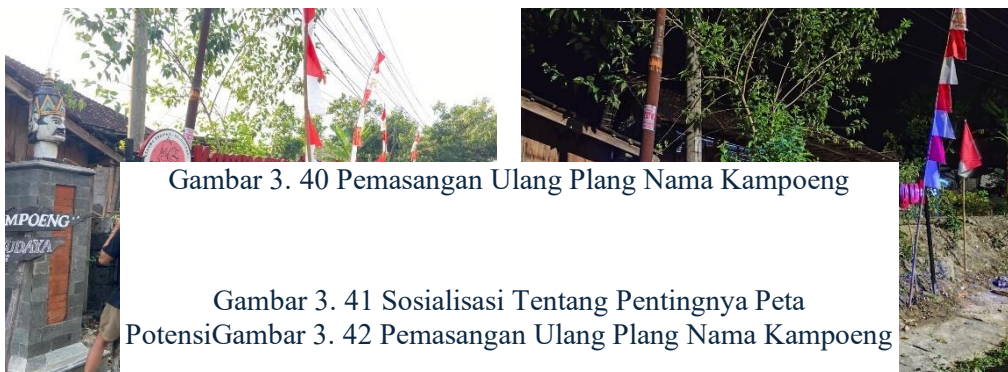
Gambar 3. 40 Pemasangan Ulang Plang Nama Kampong

Revitalisasi ini tidak hanya berfungsi memperindah tampilan desa, tetapi juga menjadi upaya menjaga eksistensi identitas budaya lokal agar tetap dikenal oleh masyarakat maupun pengunjung dari luar. Dengan adanya plang nama yang lebih menarik dan terawat, Desa Sumberjo diharapkan semakin percaya diri dalam menampilkan jati dirinya sebagai