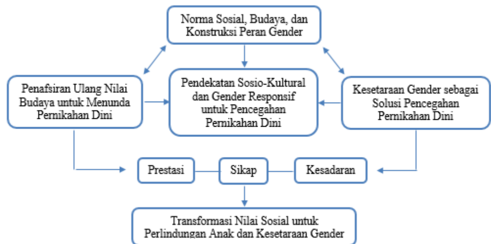
Gambar 1. Kerangka Konsep Pendekatan

keluarga atau memenuhi ekspektasi adat. Hal ini sejalan dengan temuan penelitian yang menunjukkan bahwa norma sosial dan harapan komunitas berperan signifikan dalam keputusan orang tua dan keluarga untuk menikahkan anak di usia muda, karena pernikahan dini sering dipandang sebagai solusi atas stigma sosial atau risiko yang dipersepsikan atas perilaku seksual remaja (Kalam et al., 2026). Konstruksi gender tradisional turut memperkuat praktik ini karena peran perempuan sering kali diposisikan sebagai “pelindung moral” atau tanggung jawab keluarga untuk menjaga kehormatan. Dalam banyak konteks, kekuatan norma gender ini membentuk ekspektasi bahwa perempuan harus menikah lebih awal jika dianggap sudah “dewasa” secara sosial dan budaya, meskipun secara fisik dan psikologis mereka belum siap. Penelitian lain juga menunjukkan bahwa pembentukan sikap dan perilaku ini dipengaruhi oleh norma sosial yang merasakan tekanan kolektif untuk mempertahankan tradisi, termasuk tradisi pernikahan usia muda dalam komunitas tertentu (Wahyuningsih et al., 2025).