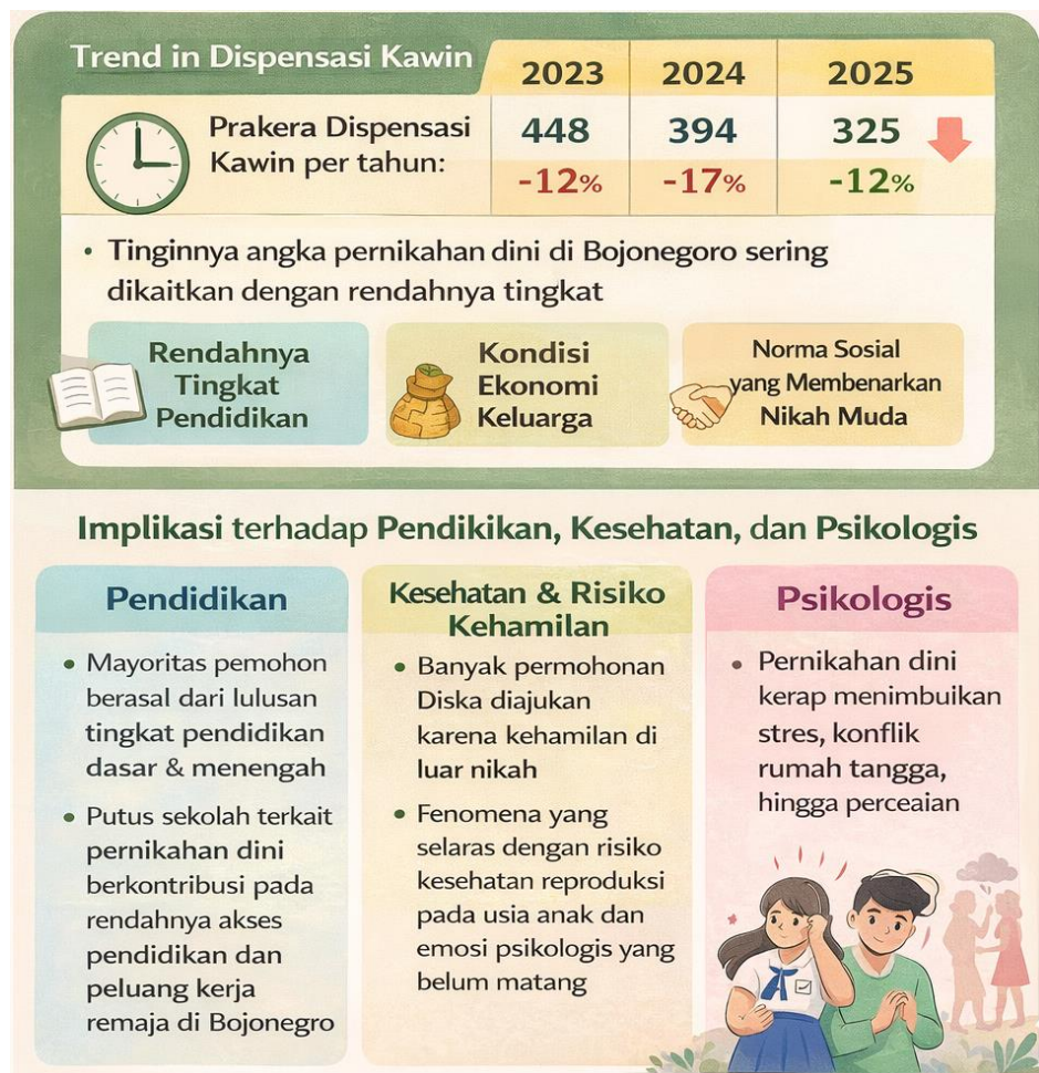
Gambar 2. Tren Dispensasi Kawin