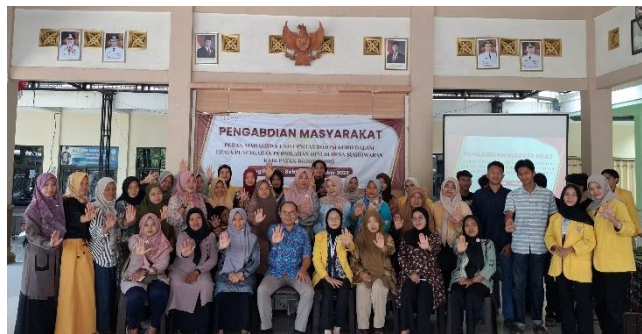
Gambar 3. Kegiatan Sosialisasi dan Edukasi