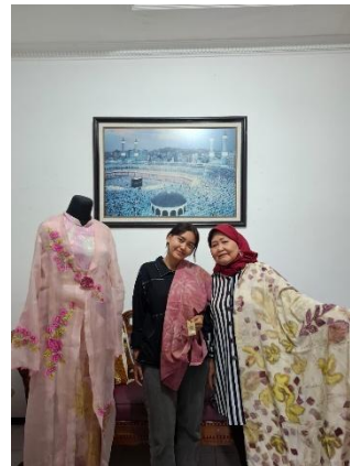
Lampiran 7 Pendampingan