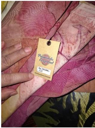
Lampiran 6 Pemasangan Tag Harga