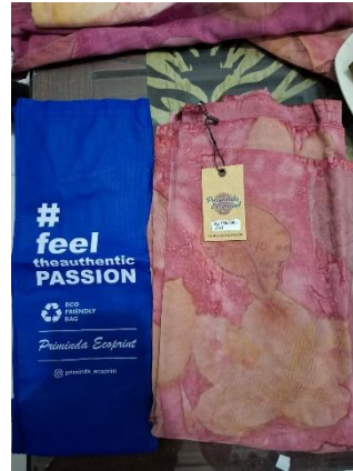
Lampiran 5 Packaging