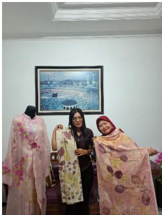
Lampiran 8 Pendampingan