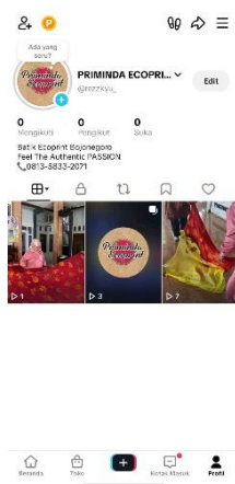
Lampiran 4 Media Promosi Digital Instagram