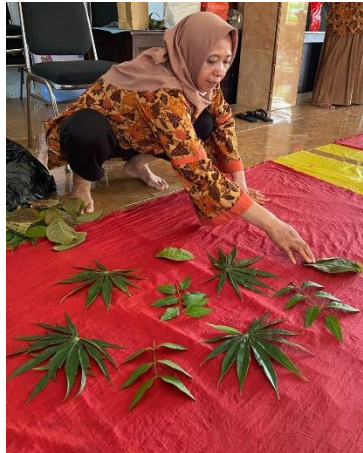
Gambar 5. 1 Pembuatan Motif Baru Ecoprint

lebih variatif dan memiliki nilai estetika yang lebih tinggi, sehingga meningkatkan daya tarik konsumen.