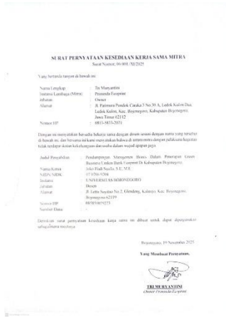
Lampiran 2 Surat Ketersediaan Mitra