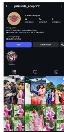
Lampiran 3 Media Promosi Digital Tiktok