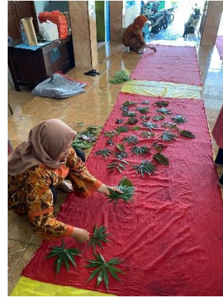
Lampiran 1 Proses Pembuatan Motif Baru