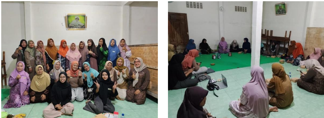
Gambar 1. Kegiatan Sosialisasi dan Edukasi

menjadi produk bernilai tambah, hingga melakukan pertukaran benih secara informal antarwarga. Forum ini menunjukkan bahwa pengetahuan lokal sebenarnya telah lama berkembang di masyarakat, namun belum terdokumentasi dan terorganisasi secara kolektif. Melalui proses berbagi tersebut, tumbuh kesadaran bahwa kerja-kerja kecil yang dilakukan secara kolaboratif memiliki dampak kumulatif terhadap ketahanan pangan komunitas.