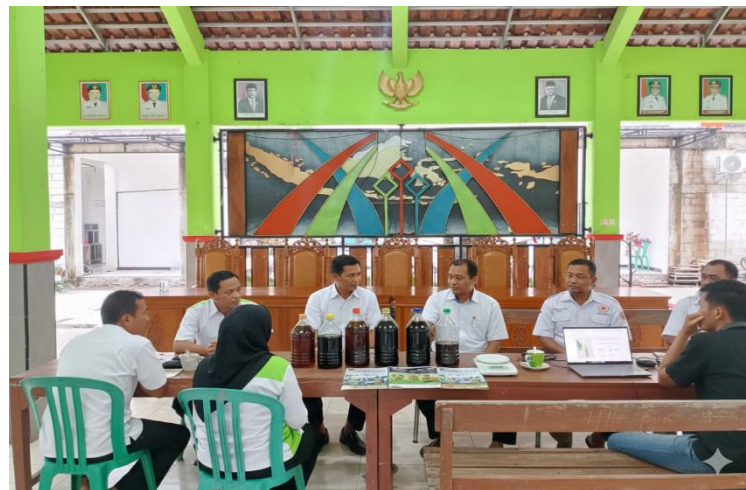
Gambar 5.2 : Sosialisasi Pengumpulan Minyak Jelantah

Partisipasi aktif masyarakat tidak hanya terlihat dari kehadiran fisik, tetapi juga dari keterlibatan dalam diskusi dan sesi tanya jawab. Masyarakat secara terbuka menyampaikan kebiasaan mereka dalam membuang minyak jelantah, kendala dalam penyimpanan, serta ketertarikan terhadap kemungkinan memperoleh manfaat ekonomi dari limbah tersebut. Kondisi ini menunjukkan bahwa pendekatan partisipatif yang digunakan mampu menciptakan ruang dialog dua arah antara tim pengabdian dan masyarakat. Tingginya partisipasi ini menjadi modal sosial penting bagi keberhasilan program, karena perubahan perilaku lingkungan sangat bergantung pada keterlibatan aktif dan rasa memiliki dari masyarakat itu sendiri.