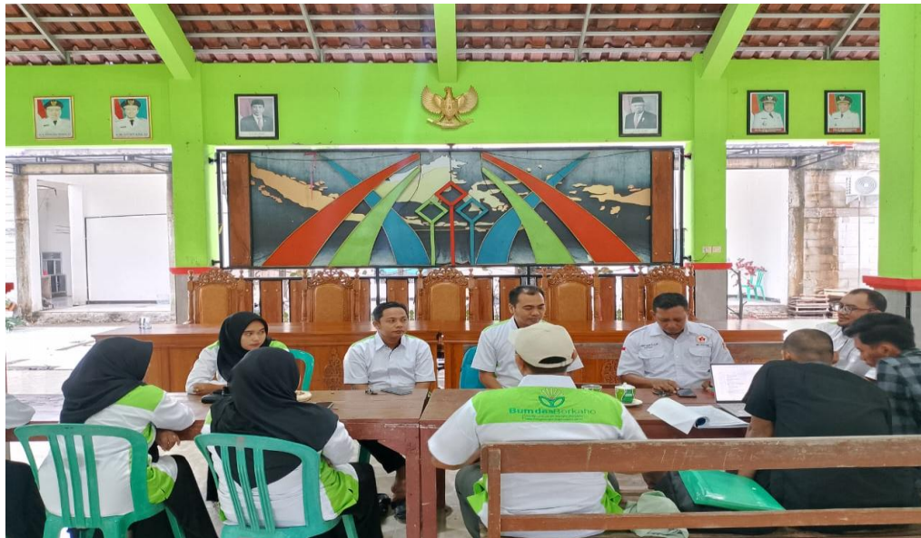
Gambar 5.1 : Pertemuan Pengurus BUMDes Berkaho

sinergi positif antara masyarakat dan BUMDes. Program tidak hanya berfungsi sebagai sarana peningkatan kesadaran lingkungan, tetapi juga sebagai langkah awal pengembangan unit usaha desa yang berbasis potensi lokal dan prinsip keberlanjutan