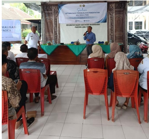
Gambar 5.1.1 Pemberian materi pengelolaan PADes

Tahap selanjutnya adalah pelaksanaan workshop peningkatan kapasitas aparatur desa. Dalam kegiatan ini, perangkat desa diberikan materi mengenai konsep dasar PADes, sumber-sumber PADes, regulasi pengelolaan keuangan desa, serta teknik komunikasi publik yang efektif. Kegiatan workshop dilakukan secara interaktif melalui diskusi, studi kasus, dan simulasi penyampaian informasi kepada masyarakat. Hasil kegiatan menunjukkan adanya peningkatan pemahaman aparatur desa mengenai pentingnya transparansi dan sistematika sosialisasi pengelolaan PADes.