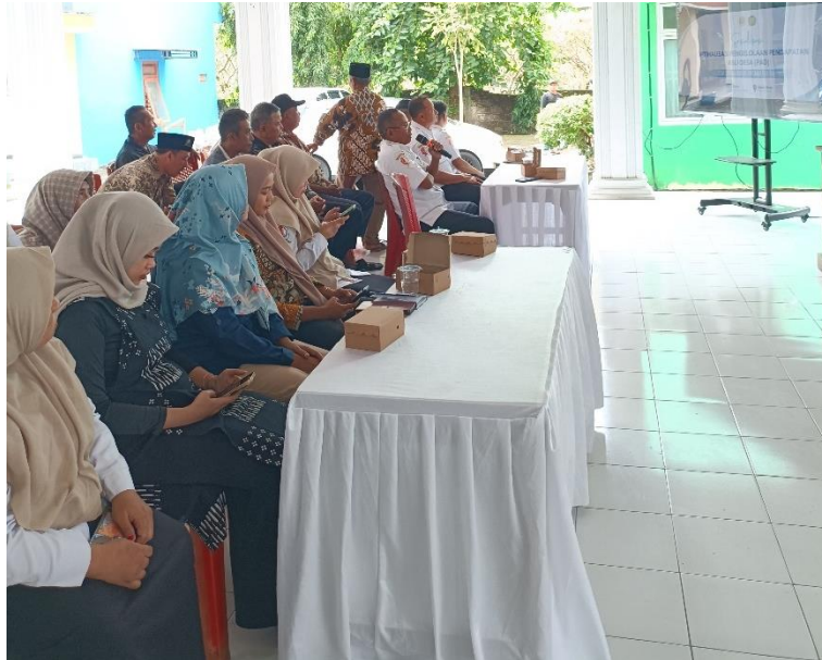
Gambar 5.1.2 Sesi tanya jawab dan diskusi

Kegiatan sosialisasi kepada masyarakat juga telah dilaksanakan sebagai bagian dari implementasi program. Sosialisasi dilakukan melalui forum dialog dan penyampaian materi secara langsung kepada masyarakat desa. Hasil kegiatan menunjukkan bahwa masyarakat menjadi lebih memahami konsep PADes, sumber-sumber pendapatan desa, serta pentingnya keterlibatan masyarakat dalam mendukung transparansi pengelolaan keuangan desa. Secara keseluruhan, hasil pendampingan menunjukkan bahwa program pengabdian ini berhasil meningkatkan kapasitas aparatur desa, memperkuat sistem sosialisasi PADes, serta meningkatkan pemahaman dan partisipasi masyarakat dalam pengelolaan keuangan desa