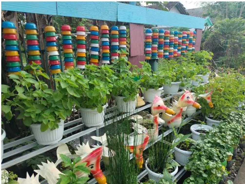
Gambar 5.3 Taman Ekowisata di Desa Sambiroto