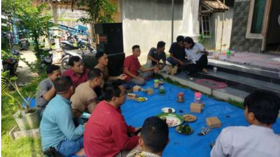
Gambar 5.1 Pelatihan pengembangan Ekowisata

Peningkatan kapasitas pemuda, khususnya dari unsur GP Ansor, mencerminkan implementasi community empowerment theory sebagaimana dikemukakan oleh Zimmerman (2000), yang menekankan dimensi psikologis, organisasi, dan sosial dalam proses pemberdayaan. Pelatihan guiding, hospitality, dan konten digital berkontribusi pada peningkatan self-efficacy dan collective agency pemuda, yang menurut Scheyvens (1999) merupakan indikator utama keberhasilan pariwisata berbasis komunitas. Keterlibatan aktif pemuda dalam perencanaan dan pelaksanaan desa wisata menunjukkan terjadinya pergeseran relasi kuasa, di mana pemuda tidak lagi berada pada posisi marginal, tetapi menjadi aktor sentral dalam pengelolaan sumber daya lokal.