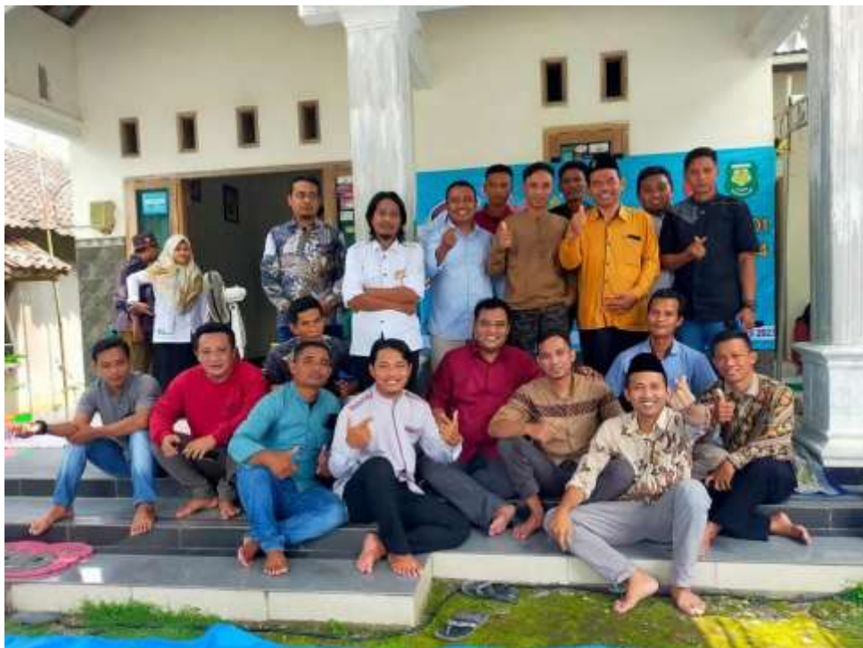
Gambar 5.2 Pelatihan Pembuatan media sosial

Keberadaan media promosi digital yang dikelola secara aktif mencerminkan penerapan digital destination marketing yang semakin relevan dalam pariwisata skala lokal (Xiang & Gretzel, 2010). Konsistensi produksi konten dan meningkatnya