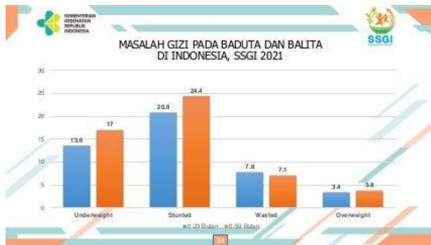
Gambar 1. Grafik Masalah Gizi Pada Baduta dan Balita di Indonesia

empat anak di Indonesia menderita penyakit ini (Zahara & Yushida, 2022). Hal ini menekankan pentingnya pendekatan yang komprehensif dan berjangka panjang untuk edukasi dan pencegahan stunting.