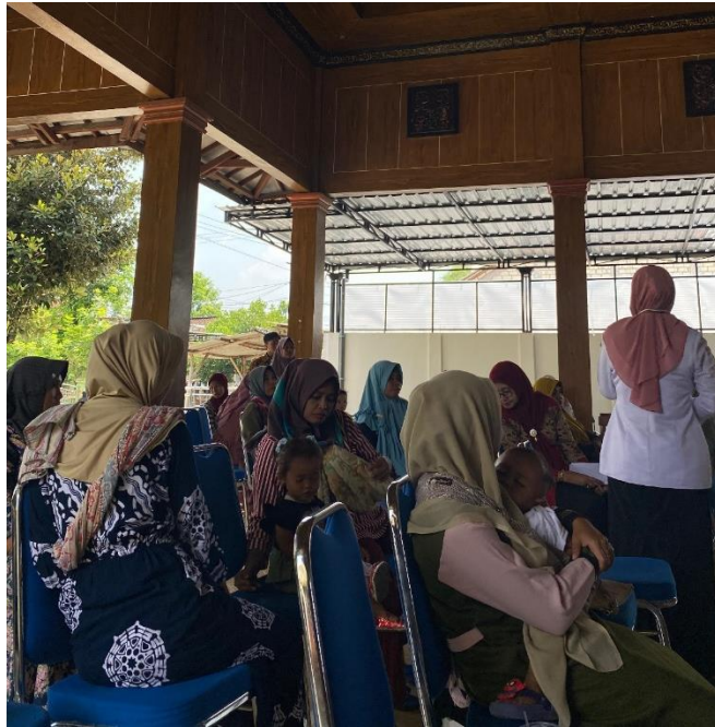
Gambar 3. Kegiatan Sosialisasi dan Edukasi (Sumber : Dokumentasi Penulis, 2025)

meningkatkan kepedulian, kesadaran, dan kemampuan masyarakat untuk berperan aktif dalam mengurangi stunting sejak dini, baik melalui perbaikan pola asuh, pola makan yang seimbang, serta pemeliharaan kebersihan lingkungan dan kesehatan keluarga.