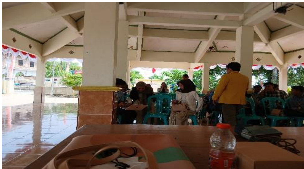
Gambar 3. Pendampingan Wajib Pajak

Pelaksanaan kegiatan juga dijelaskan terkait dengan jenis SPT Orang Pribadi sebagai berikut: