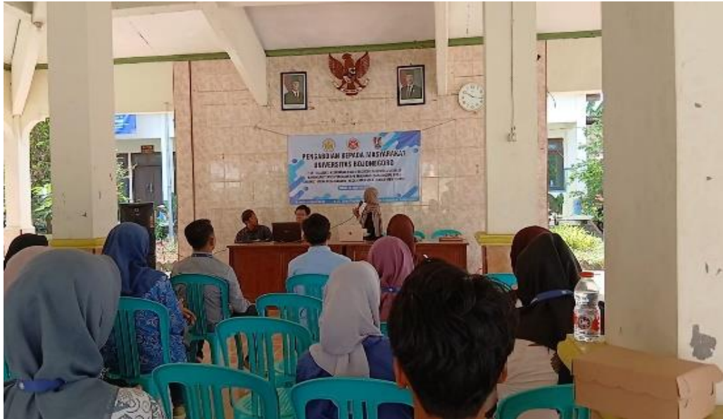
Gambar 1. Suasana Pelatihan

Selama kegiatan, peserta memperoleh pendampingan teknis mengenai: