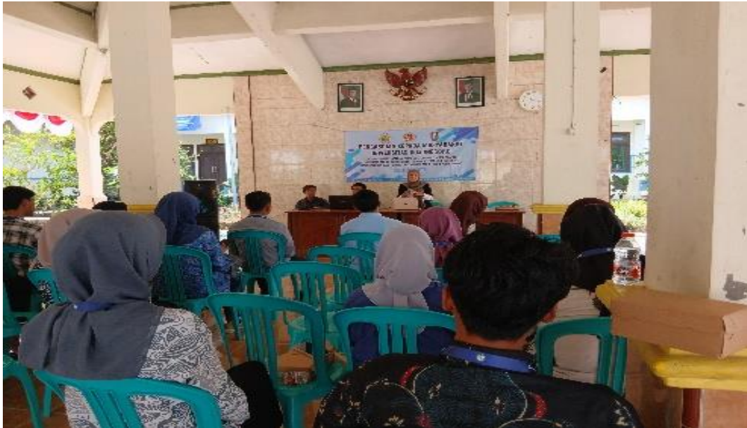
Gambar 2. Suasana Pelatihan pada Sesi Tanya Jawab