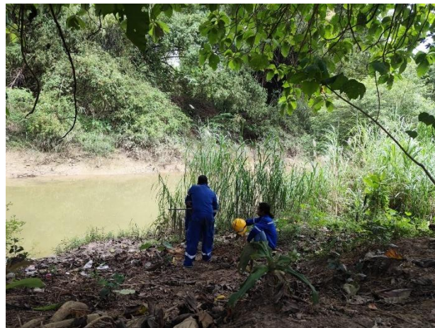
Gambar 5. 2 Pengeboran Tanah Dangkal

Pekerjaan bor dalam adalah pekerjaan membuat lubang dengan menggunakan mata bor type Iwan kecil kurang lebih 3” (7.50 cm), mata bor Iwan ini disambung dengan stank bor @ 1.00 meter, kedalaman pengeboran untuk setiap titik bor adalah 5 meter dari muka tanah atau sesuai kebutuhan perencanaan atau pihak pengawas dilapangan.