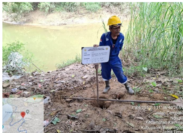
Gambar 5. 3 Pengambilan Sampel Tanah Tidak Terganggu (Undisturbed Sample).

Untuk contoh tanah yang terganggu diambil setiap interval 0.50 meter atau sesuai kebutuhan perencanaan atau pihak owner dan pengawas dilapangan dan dilakukan sampai dengan kedalaman akhir pengeboran.