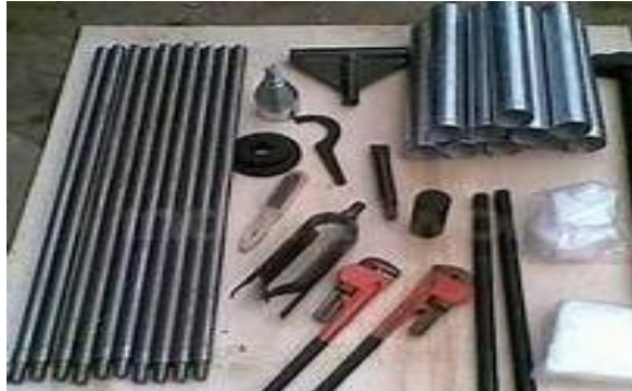
Gambar 5. 1 alat uji hand bor